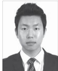
박재철 기자 편집국 취재 1팀

최근 데크플레이트(이하 데크) 제조업체가 신규 먹거리 사업 발굴에 한창이다.